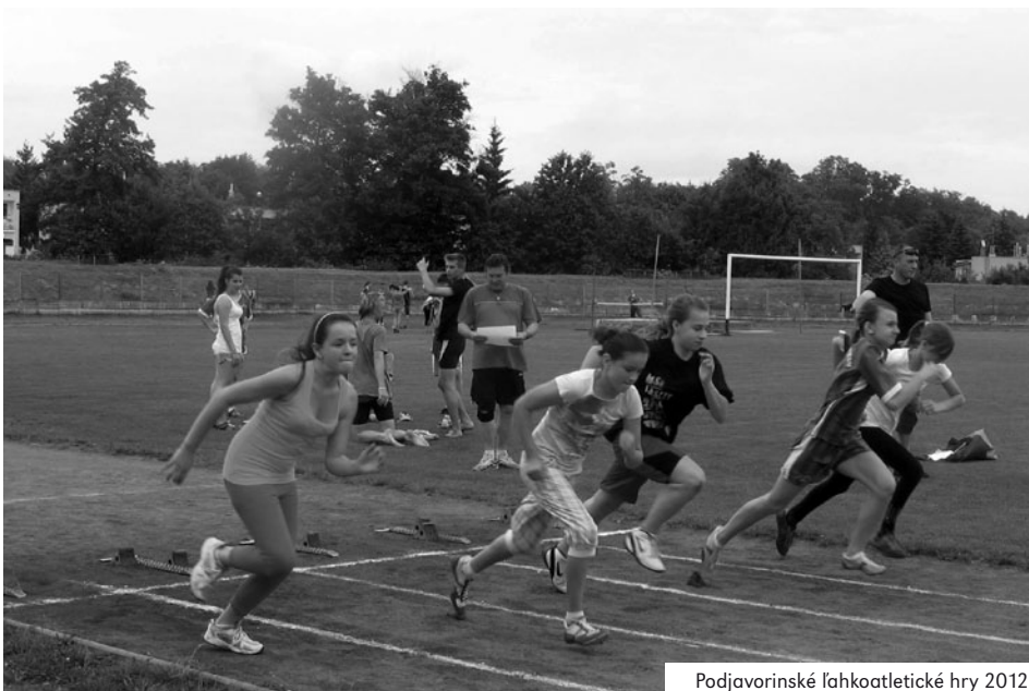
Podjavorinské ľahkoatletické hry 2012