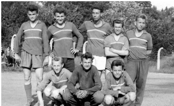
Hádzanári OU Prema – mladší dorast v r. 1959