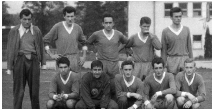
Po víťazstve nad Pedagógom Nitra 27.10.1963

V r. 1963 sa uskutočnil I. ročník „O putovný pohár Presnej mechaniky v hádzanej mužov“. Bol veľmi dobre organizovaný. Zúčastnili sa ho družstvá Spartaku Myjava, Premy Stará Turá, víťazného Slovanu Piešťany a asi Dukly Nové Mesto n. V.