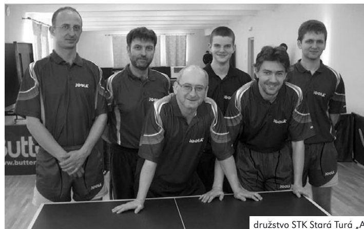
družstvo STK Stará Turá „A“