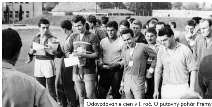
Odvzdávanie cien v I. roč. O putovný pohár Premy