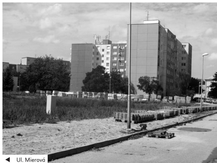
◀ Ul. Mierová