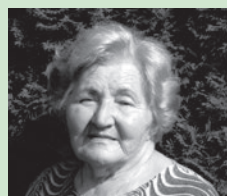
DCéra a syn s rodinnami

Máme Ťa všetci veľmi radi a vďaka za to, že si tu teraz v tejto krásnej chvíli s nami.