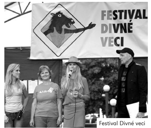
Festival Divné veci