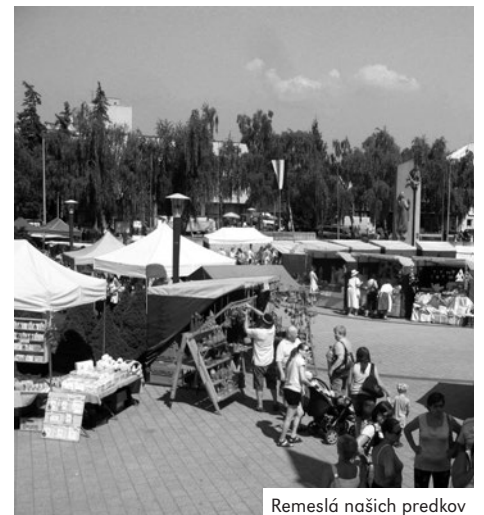
Remeslá našich predkov