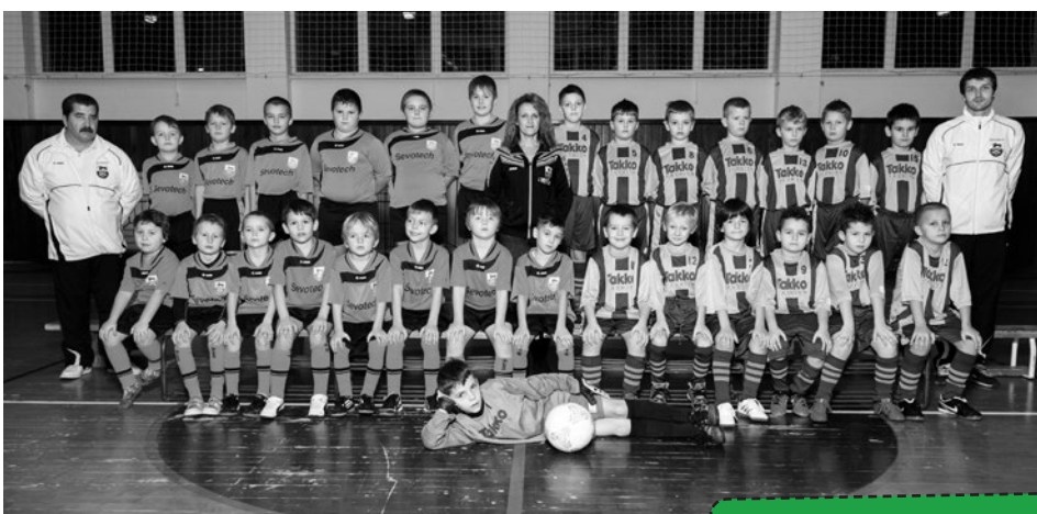
Príprava MFK Stará Turá sa počas tejto sezóny rozrástla.

Oddelenie výstavby, územného plánovania a životného prostredia MsÚ