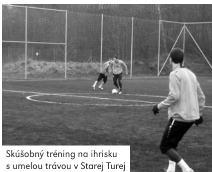
Skúšobný tréning na ihrisku s umelou trávou v Starej Turej