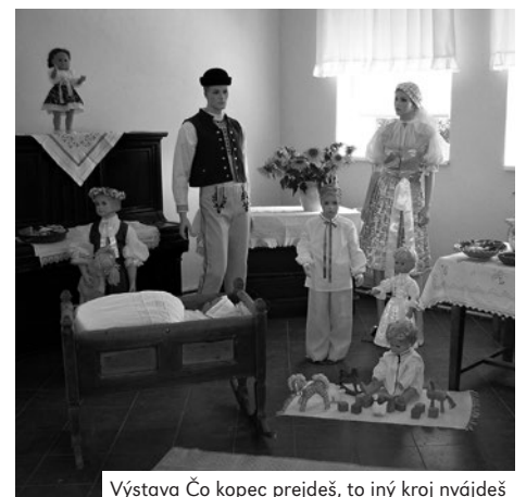
Výstava Čo kopec prejdeš, to iný kraj nájdeš