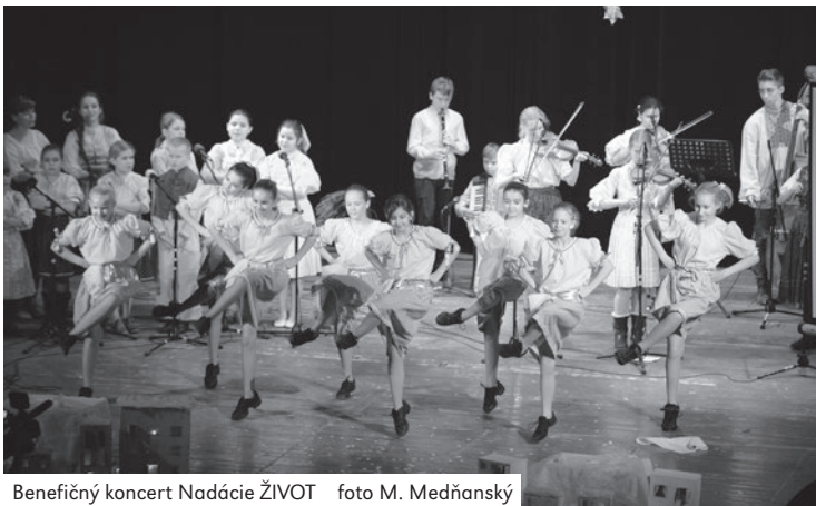
Benefičný koncert Nadácie ŽIVOT

Všetkým čitateľom, prispievateľom a spolupracovníkom praje redakcia Staroturianskeho spravodajcu najmä veľa zdravia, ale aj dostatok šťastia, lásky a vzájomného porozumenia v novom roku 2016.