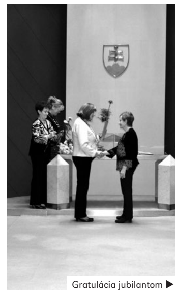
Gratulácia jubilantom ▶