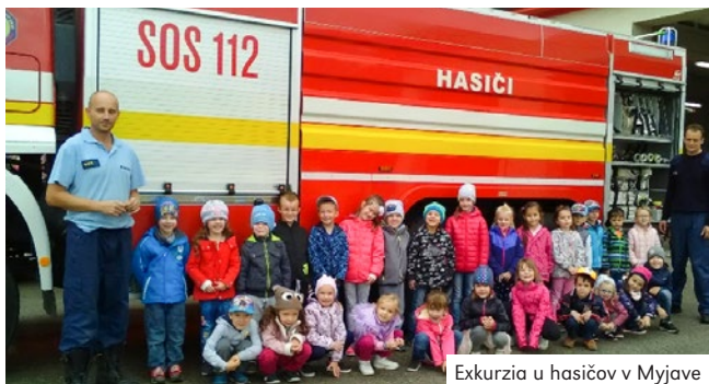
Exkurzia u hasičov v Myjave