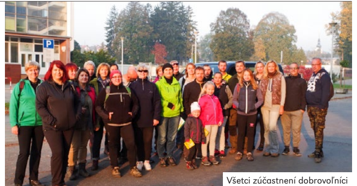
Všetci zúčastnení dobrovoľníci

Stretli sme sa pred výskovkou budovu Chirany, odtiaľ sme sa presunuli do Topoleckej, ku kancelárii Lesoturu. Všetkých 29 účastníkov bolo zaškolených a odborne poučených, ako má táto výsadba