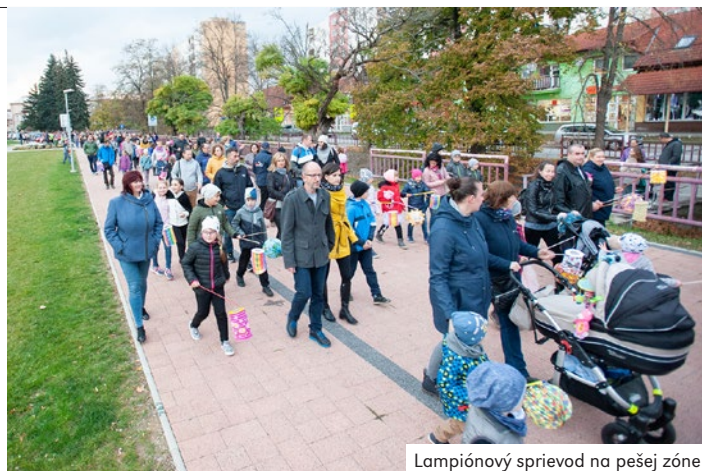
Lampiónový sprievod na pešej zóne

Po tejto oficiálnej časti sa celý lampiónový sprievod presunul stredom mesta až k autobusovej