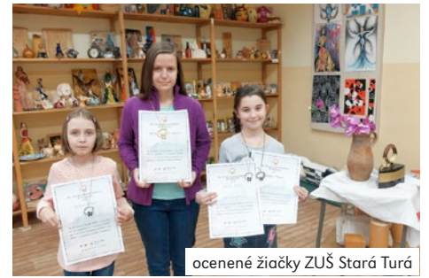
ocenené žiačky ZUŠ Stará Turá