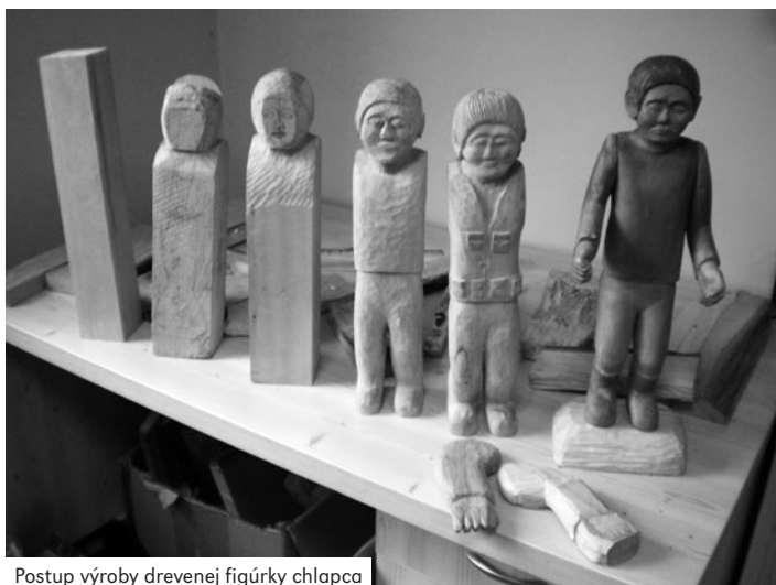
Postup výroby drevenej figúrky chlapca