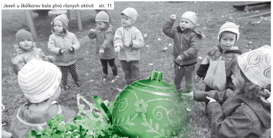
Jeseň u škôlkarov bola plná rôznych aktivít str. 11