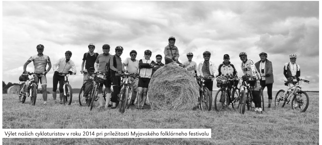
Výlet našich cykloturistov v roku 2014 pri príležitosti Myjavského folklórneho festivalu

Všetkých spájalo čosi, čo sa len ťažko dá definovať. Bola to láska k prírode, k tej podbradlansko-podjavorinskej či bielokarpatskej zvlášť, nevynímajúc Myjavskú pahorkatinu, k jej bližšiemu vlastivednému poznávaniu, k pohybu pre zdravie i zábavu, vašeň v podobe dvoch magických kolies, alebo to boli tiež medzifúdké vzťahy, staré i nové priateľstvá, pocity solidarity (napríklad pri odstraňovaní porúch, či vyčkávaní oneskorencov), vzájomná pomoc a poradenstvo pri bicykloch alebo aj mimo nich, alebo to bola len prostá radosť zo života, rozumný spôsob trávenia voľného času, starostlivosť o vlastné zdravie? To všetko, pospätané do jedného venca aj za pomoci sociálnych sietí na internete, ktoré umožnili zvolanie a zaznamenávanie podujatí vrátane publikovania pôsobivých fotografií, ich hodnotenia či vyjadrovania emócií. Ako sa hovorí, z každého rožka troška. To, čo my vieme