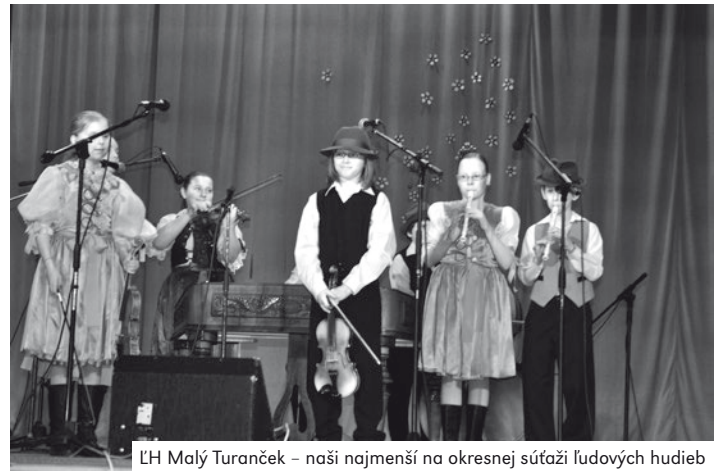
LH Malý Turanček – naši najmenší na okresnej súťaži ľudových hudieb

FS Kopaničiar, DFS Kopaničiarik, FS Kopa, FS Brezová, FS Kýčer. Zdá sa Vám to povedomé? Áno, je to možné, sú to totiž folklórne súbory práve z nášho okolia. FS Kýčer bol u nás vystupovať už neraz a vždy mali úctyhodné obecenstvo. Vo svojom programe majú aj muziku, aj spevákov, aj speváčky a taktiež tanečníkov, ktorí dokážu ľudí najviac zaujať. Je to najmä ich tvorivými scénkami a rôznymi tancami. Niet sa čomu čudovať, že kde je viac ľudí, je väčšia radosť a odhodlanie. Nenadarmo sa vraví, viac hláv, viac rozumu. Preto sa nám priam núka otázka, prečo aj naše mesto nemôže mať súbor? Vytvoriť folklórny súbor, ktorý by reprezentoval Starú Turú by nebolo vôbec zlé. Ludových hudieb na doprovod tanečníkov máme dosť a dokonca pre všetky vekové kategórie. Teraz nám už len stačí zohnať ďalších nadšencov, ktorí by venovali čas skúšaniam a učeniu sa nových piesní a tancov. Človek si povie, čo tým získam? Odpoveď je veľmi jednoduchá, kopu nových známych a priateľov, nové zážitky a skúsenosti, na ktoré sa nezabúda a taktiež sa objavuje možnosť vycestovať do rôznych krajín a ďalej prezentovať náš tradičný folklór. Cesta k víťazstvu býva trnistá, a preto by aj tieto naše sny spravádzala tvrdá drina, ktorá by sa však oplátila a stála by zato. Dvere sú otvorené pre všetkých, stačí len vojsť.