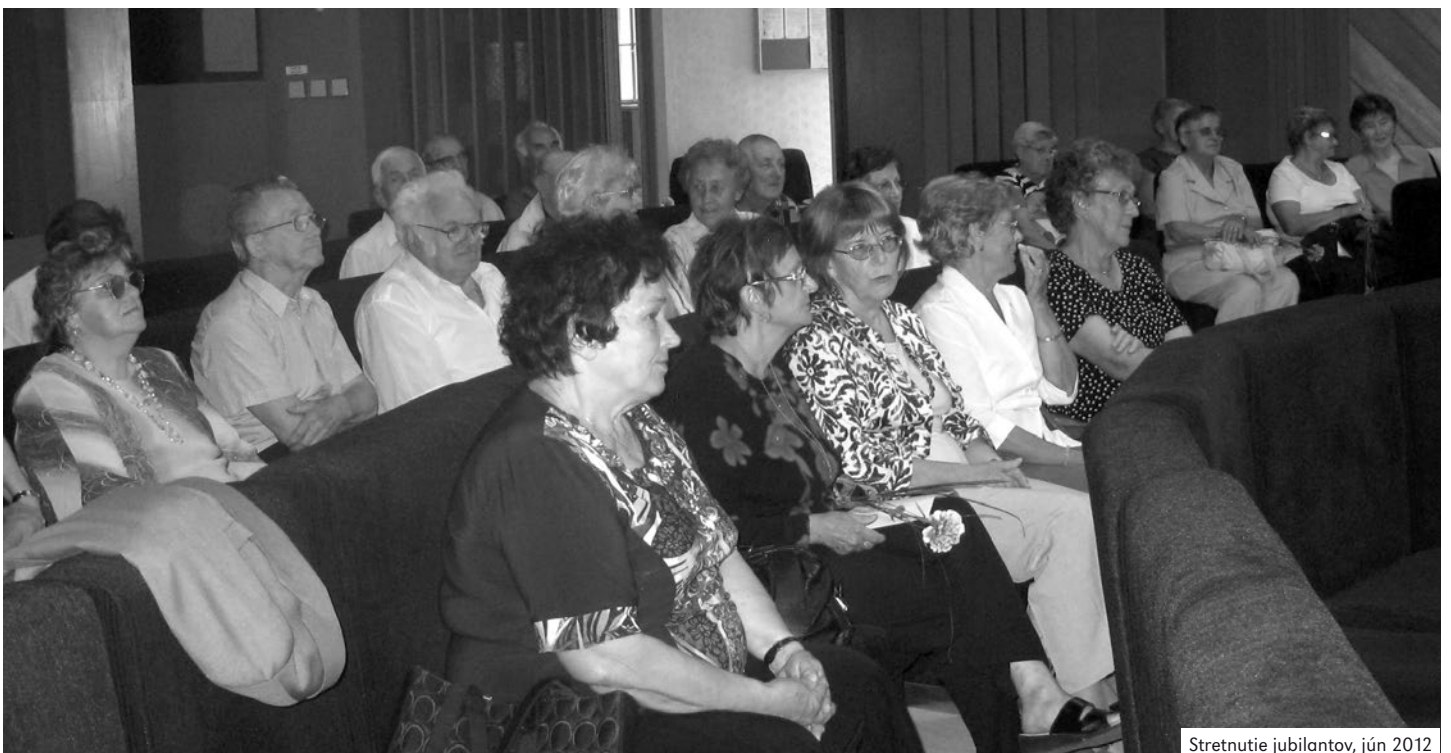
Stretnutie jubilantov, jún 2012