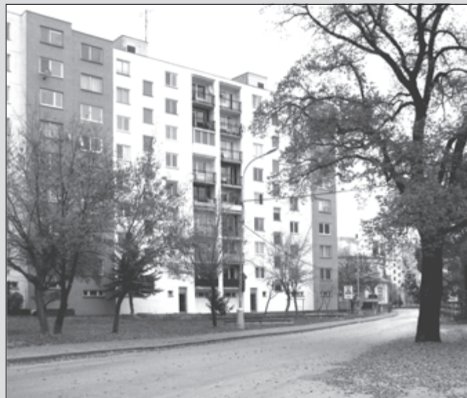
Jeseň prišla do ulíc nášho mesta... (J. M.)