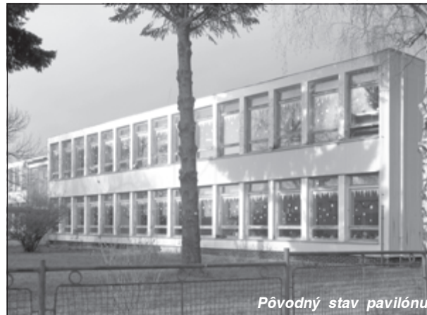
Pôvodný stav pavilónu

zriadaťel' školy bolo postavené pred rozhodnutie: buď školu zrekonštruovať alebo ju zatvoriť a prípadne použiť ju pre iné účely.