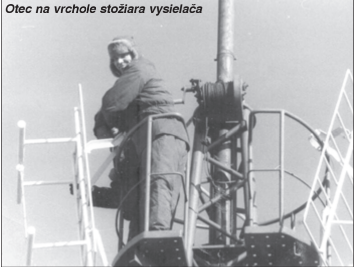
Otec na vrchole stožiaru vysielateľa

klonený technickým novinkám (bývali v tom čase v jednom činžiaku), tak obaja mohli účinne spolupracovať. Na Starej Turej sa nedarilo chytiť televízny signál, ale na Veľkej Javorine už nejaký signál bol. Preto jediným riešením ako dostať signál do Starej Turej a celého okolia, vrátane Moravy, bolo potrebné tu vybudovať retranslačný vysielateľ.