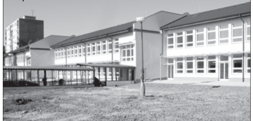
Stav po rekonštrukcii

Takýmito riešeniami sa dosiahol výrazného šetrenia tepla. Počas rekonštrukcie školy sa zistili v existujúcej stavbe aj závažné statické problémy, ktoré sa počas rekonštrukcie priebežne odstraňovali.