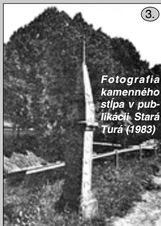
Fotografia kamenného stĺpa v publikácii Stará Turá (1983)