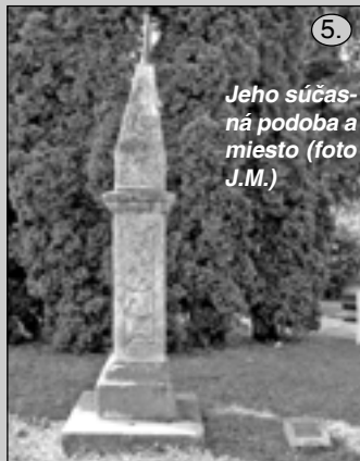
Jeho súčasná podoba a miesto