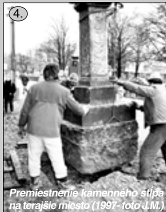
Premiestnenie kamenného stĺpa na terajšie miesto (1997)