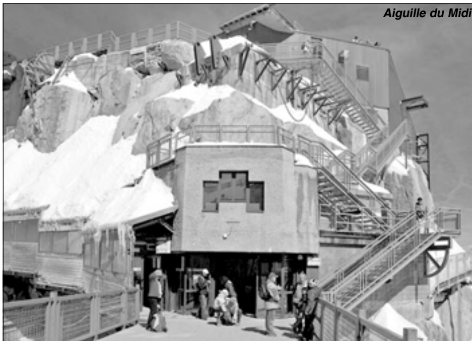
Aiguille du Midi

Pred obedom sme odišli do Ženevy, kde sme mali dohovorenú prehliadku Paláca národov, kde sídlia niektoré orgány OSN. OSN je medzinárodná organizácia založená 24.10.1945 po ratifikácii Charty OSN. Ciele OSN sú udržiavať medzinárodný mier, bezpečnosť, uskutočňovať medzi národmi spoluprácu vo všetkých oblastiach života. Hlavné orgány OSN sú: Valné zhromaždenie, Rada bezpečnosti, Hospodárska a sociálna rada, Poručenská rada a sekretariát so sídlom v New Yorku a Medzinárodný súdny dvor v Haagu. Mnohé vedľajšie orgány samozrejme sídlia i v Ženeve, ale i v iných mestách. Ako sprievodkyňu sme mali Slovenku, ktorá tam pracuje už 13 rokov a sprevádza v 4 až v 5 rečiach. Videli sme 2 zo 4 najväčších sál. Obidve boli výnimočné, jedna bola v zlatých tónoch a mala kapacitu asi 800 miest. Druhá „španielska“ bola výnimočná stropom, z ktorého viseli „kvaple“ rôznych tvarov a farieb. Ďalšie dve rokovacie sály sme nemohli vidieť, lebo tam prebiehali dôležité zasadania. Bohužiaľ sme pre prísne bezpečnostné opatrenia