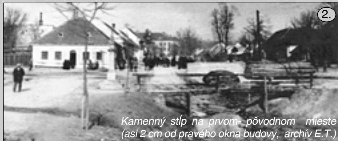
Kamenný stĺp na prvom - pôvodnom mieste (asi 2 cm od pravého okna budovy)