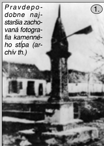
Pravdepodobne najstaršia zachovaná fotografia kamenného stĺpa