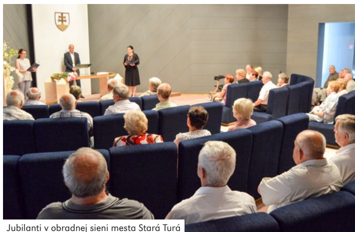
Jubilanti v obradnej sieni mesta Stará Turá

za redakciu M. Krč