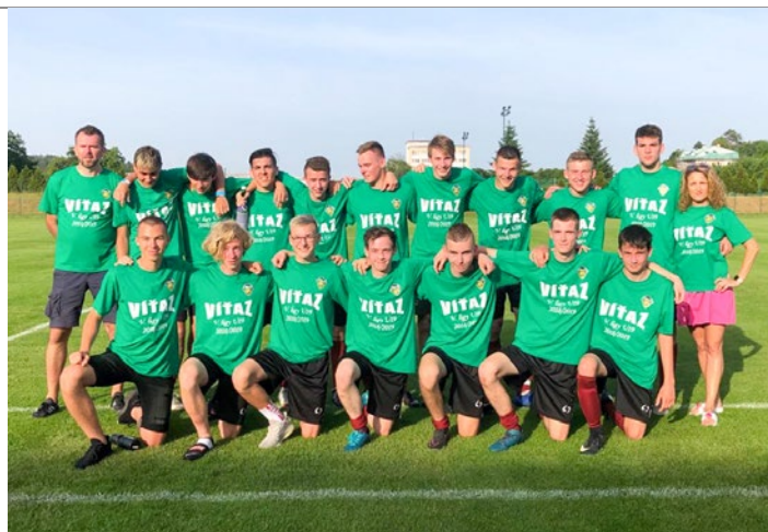
MFK Stará Turá (DORAST) – víťaz 5. ligy SEVER U19