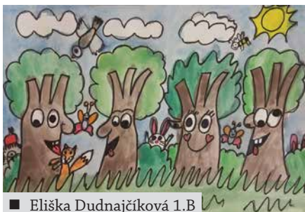
■ Eliška Dunajčíková 1. B