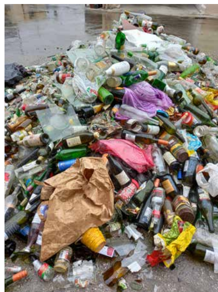
■ Vysypané nádoby na sklo s množstvom nečistôt, ktoré do skla nepatria! Sklo, ako aj iné triedené zložky, sa dotriedujú ručne.