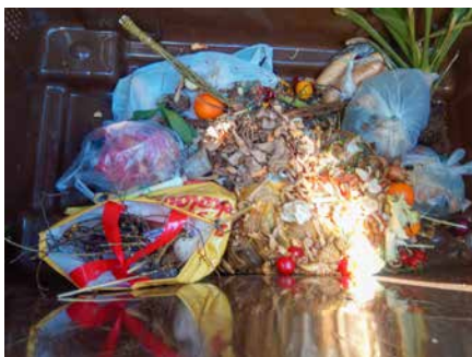
■ Do bioodpadu prosím nevhadzujte plastové vrecká, tašky alebo vrecká!