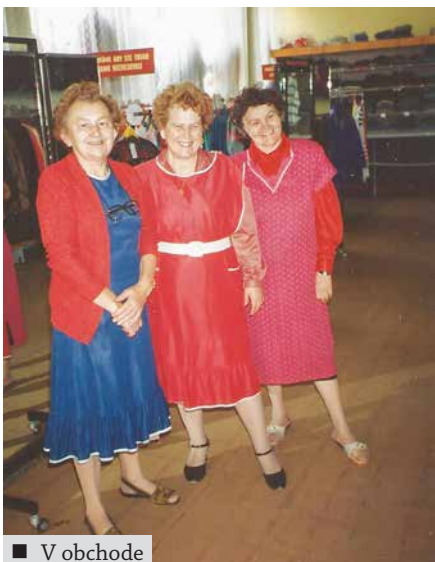
■ V obchode