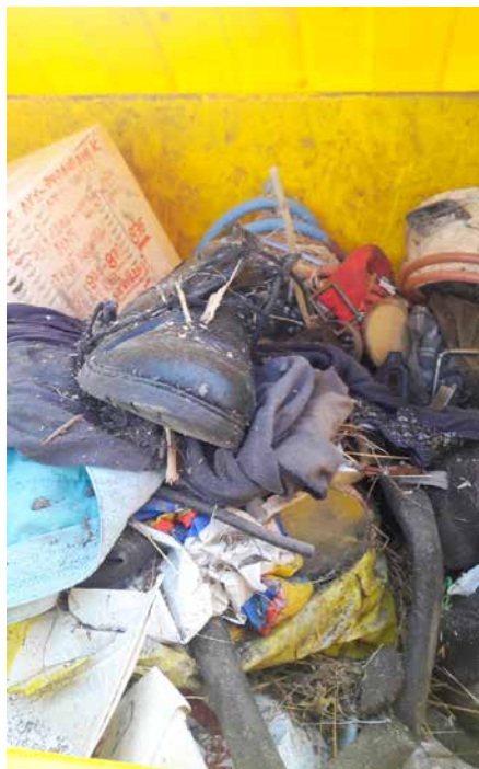
■ Nádoba na plasty znehodnotená zmesovým komunálnym odpadom.

Milí občania, s témou triedenia odpadu sa stretávame pomerne často. Farebné odlišenie kontajnerov, obrázky alebo texty, ktoré nám napovedajú čo do daného kontajnera patrí, letáky s informáciami o triedení odpadu a mnoho iného stále niekedy nestačia.