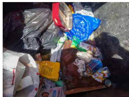
■ Nádoba na kovy znehodnotená zmesovým komunálnym odpadom.

► celú sezónu a všetko si s nimi odžila a vždy tu pre ne bola. Mojou úlohou bolo pomôcť celému tímu na tomto turnaji a snáď sa mi to aspoň trošku podarilo. Túto výhru by sa nám ale nikdy nepodarilo dosiahnuť bez p. Neráda, ktorý nás neustále podporuje a vytvára nám tie najlepšie podmienky. Táto trofej je do veľkej miery jeho zásluhou.