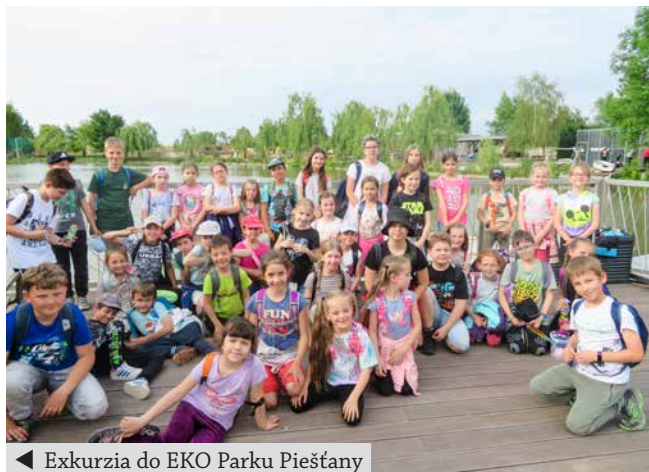
◀ Exkurzia do EKO Parku Piešťany