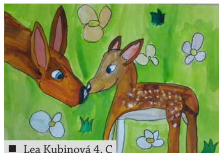
■ Lea Kubinová 4. C