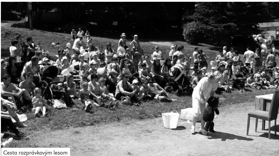
Cesta rozprávkovým lesom