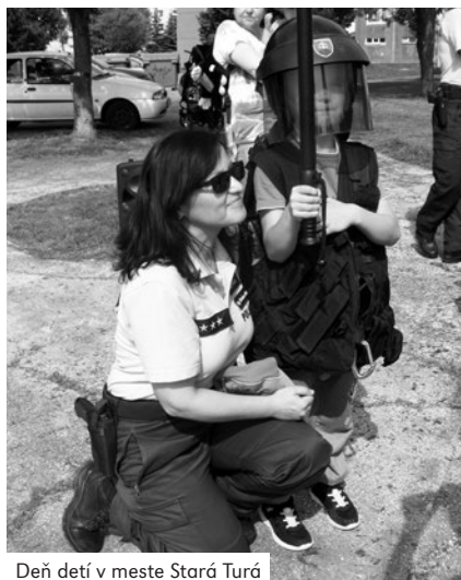
Deň detí v meste Stará Turá

kontakt: 0948 308 448 prevádzka Bzince pod Javorinou