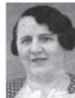
Perotka Schrecktárová Dúbrava do r. 1919