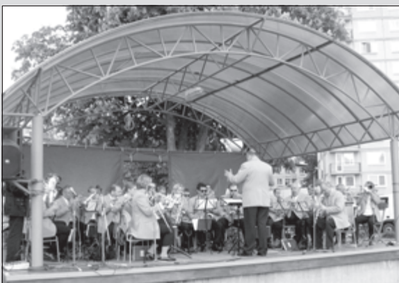
Kapela LYRA z Mainzu (Nemecko) koncertovala 22. mája na Námestí slobody.

Podakovanie patrí výboru MFK a všetkým, ktorí sa podieľali na príprave a organizácii. Miroslav Adásek