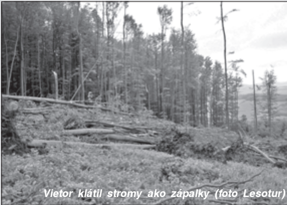
Vietor klátil stromy ako zápalky