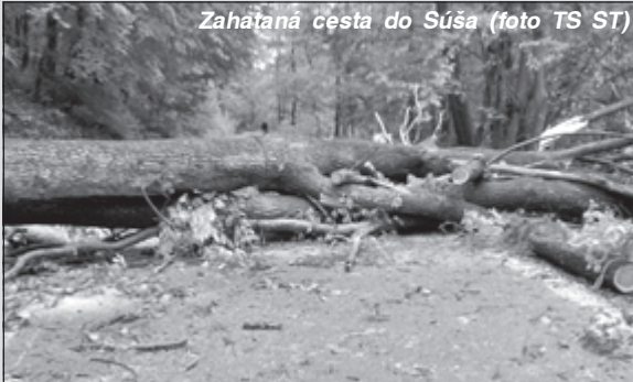
Zaháňaná cesta do Súša

Neustále prehánky v mesiaci máj potešia samozrejme nielen záhradkárov, poľnohospodárov, ale v neposlednom rade i lesníkov. To čo nás však postihlo predposledný májový víkend určite neočakával nikto z nás.