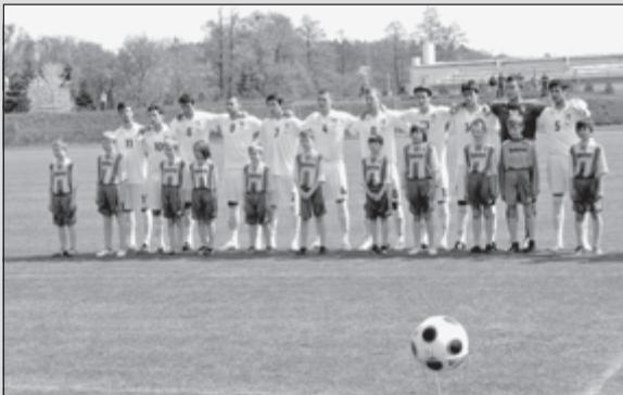
Celkový víťaz turnaja mužstvo Talianska, ktorých na ihrisko dovedli naši mladší žiaci MFK.

A skupina: Slovensko, Belgicko, Chorvátsko a Rusko B skupina: Česká republika, Dánsko, Ukrajina a Taliansko Zápasy sa odohrali výhradne na štadiónoch trenčianskeho kraja. Dňa 27.4.2010 sa uskutočnil na štadióne MFK Stará Turá zápas skupiny B Ukrajina – Taliansko 0:1 (0:1). Taliansko sa zároveň stalo víťazom celého turnaja. Tento zápas bol spestrený počas prestávky folklórnym súborom Turanček