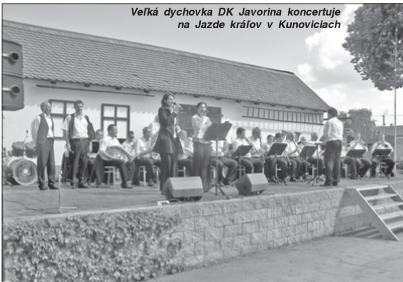
Veľká dychovka DK Javorina koncertuje na Jazde kráľov v Kunoviciach