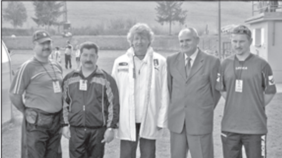
Na fotografii organizátori turnaja s talianskym majstrom sveta z roku 1982 Giancalom Antognonim.

V dňoch 26. - 30.4.2010 sa uskutočnil medzinárodný futbalový turnaj Slovakia cup 2010 do 18 rokov. Turnaj organizoval SFZ v spolupráci so ZsFZ. Tohto roku prevzal nad turnajom záštitu premiér Slovenskej republiky Róbert Fico. Za predchádzajúce roky si turnaj vybudoval významné postavenie medzi mládežníckymi turnajmi v celej Európe, čo potvrdzuje aj fakt, že sa na ňom zúčastnila nejedna vyspelá futbalová krajina so svojim reprezentačným výberom. Turnaj bol rozdelený do dvoch skupín po 4 účastníkoch.