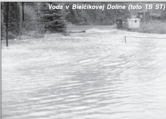
Voda v Bielčikovej Doline

Zber bioodpadu v našom meste začína naplno!