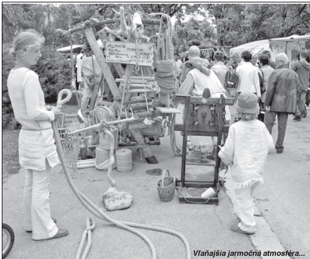
Vlaňajšia jarmočná atmosféra...