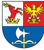
TREŇČIANSKY SAMOSPRAVNÝ K · R · A · J

Ľudia si uvedomujú riziká, ktoré ohrozujú ich život, zdravie alebo ich majetok až vtedy, keď sú priamymi účastníkmi havárií, živelných pohrôm alebo katastrof. Dôsledky takýchto mimoriadnych udalostí potvrdzujú, že neznalosť vhodného reagovania na vzniknutú situáciu alebo jej podceňovanie spolu s panikou znásobujú straty za životoch a zvyšujú počet zdravotných poškodení ľudí. I keď jednotlivec pri mimoriadnej udalosti nemôže zvrátiť beh udalosti, môže vhodnou voľbou správania výrazne znížiť dopad jej následkov vo svojom okolí.