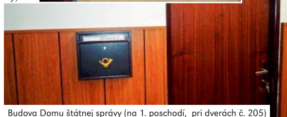
Budova Domu štátnej správy (na 1. poschodí, pri dverách č. 205)