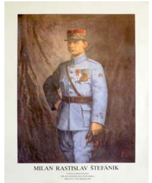
Obraz Milana Rastislava Štefánika

No a to trete čo treba vysloviť je, aby sme pri bradlianskom symbole suverenity a demokracie nezabudli na Štefánika ako mysliteľa, žiaka a spolupracovníka Tomáša Gariqua Masaryka. Štefánikove myšlienky ďaleko presiahli dobu jeho krátkeho života. Bolševikov (nie národ Rusov!) označil za duchovných barbarov a podobný postoj by