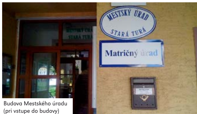
Budova Mestského úradu (pri vstupe do budovy)

Schránky sa nachádzajú na týchto miestach: