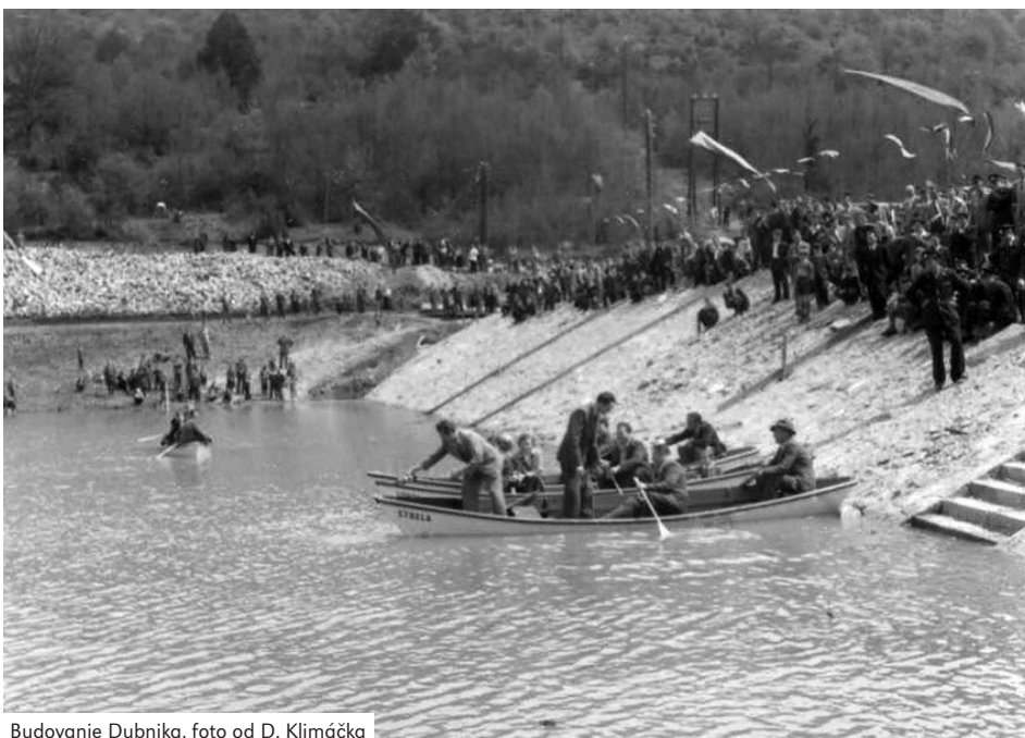
Budovanie Dubníka, foto od D. Klimáčka