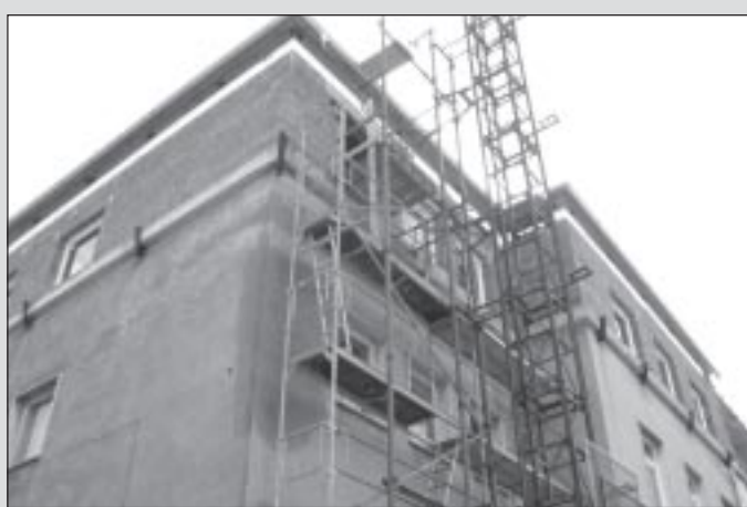
Rekonštrukcia DK Javorina prinesie o. i. nové priestory na 3. podlaží v zadnej časti budovy.

Brezina Thomas: Šialene šialené prázdniny, Brezina Thomas: Prípad pre teba a tigri tím 44., Rennison Louise: A vtedy mi spadli do ruky, Rennison Louise: -práve zožral moje lapače chalanov, Awdry Wilbert Vere: Dobrodružstvá rušňa Tomáša 11., Kol.: Drevený zámoček