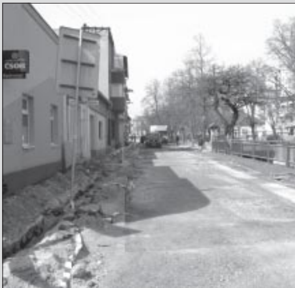
Rekonštrukcia centrálnej mestskej zóny, na Ul. SNP po pravej strane potoka, sa začala.

Zároveň sme na celom sídlisku Kujanovec vymenili 110 l nádoby na odpad za 1100 l kontajner (1 kontajner = 10 malých nádob). Boli zlikvidované aj staré tzv. „bunkre“ na nádoby. Kontajnery boli rozmiestnené približne na tých istých miestach ako boli umiestnené „bunkre“. Občania môžu na svoj odpad využiť ktorýkoľvek z kontajnerov, ktorý je k ich bytovému domu najbližší. J. Vráblová, TSST