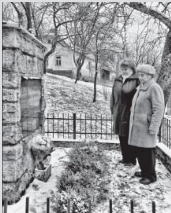
Na tragické udalosti v našej osade Hlavina z marca 1945 nezabúdame... (J. M.)