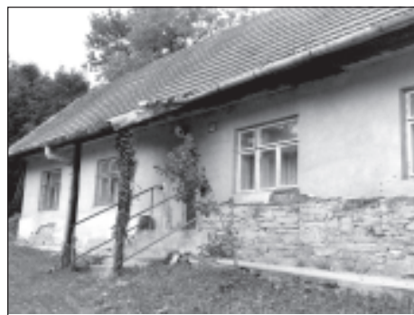
Škola v Hornom Súši u p. Mikulca

V nedeľu sa v škole premietali filmy, pre deti to bol veľký zážitok. V škole sa nachádzala i knižnica, ktorú mohli obyvatelia Súša využívať. V čase, keď už navštevovala strednú školu, jej raz v knižnici v škole nová učiteľka rozprávala, ako išla po prvý krát do školy v Súši. Prišla vlakom z N.M.n.V. a potešila sa pri prvej tabuli s názvom Súš, ale to boli iba Trávniky, potom u Samkov atď. Po 1 hodine prišla do vytúženného cieľa- školy v Súši, ale prvý i poslednýkrát túto cestu absolvovala v ihličkách.