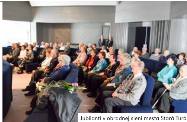
Jubilanti v obradnej sieni mesta Stará Turá

I my týmto spôsobom ešte raz ďakujeme všetkým zúčastneným jubilantom a želáme im, aby boli naďalej plný životného optimizmu, tešili sa dobrému zdraviu a sprejvázala ich radosť a spokojnosť na každom kroku.