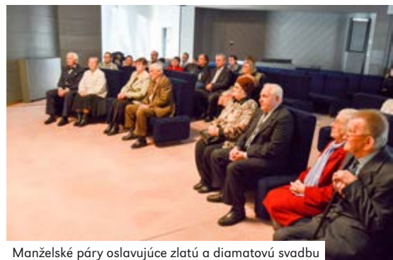
Manželské páry oslavujúce zlatú a diamantovú svadbu

V nasledujúci deň nás čakala ďalšia príjemná udalosť. V obradnej sieni mesta Stará Turá, si 6. februára 2019 pripomenul 1 staroturiansky manželský pár 50 rokov spoločného spoluzitia – zlatú svadbu a 3 manželské páry dokonca 60 rokov – diamantovú svadbu.