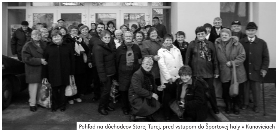
Pohľad na dôchodcov Starej Turej, pred vstupom do Športovej haly v Kunoviciach