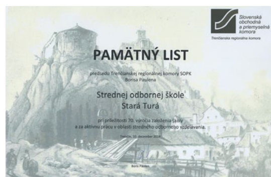
Pamätný list SOŠ Stará Turá udelený Slovenskou obchodnou a priemyselnou komorou

okien, zateplenie a fasáda, vybudovanie nového vestibulu – oddychovej zóny pre žiakov. Tiež rekonštrukcia kuchyne, jedálne a „inteligentného“ osvetlenia v jedálni, ktorá už pripomína skôr reštauráciu lepšej cenovej skupiny. Za to patrí vďaka zriaďovateľovi školy – Trenčianskemu samosprávne mu kraja a firme OMS Dojč, s ktorou škola dlhodobo úspešne spolupracuje (za realizáciu inteligentného osvetlenia). Pripravuje sa komplexná rekonštrukcia telocvične, oprava strechy internátu a v rámci projektu iROP aj rekonštrukcia dielní a ďalšie zlepšenie technického vybavenia školy.