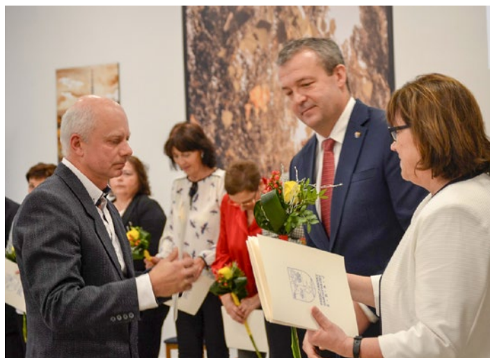
Odovzdávanie pamätných listov za obetavú prácu dlhoročným pedagogickým i nepedagogickým zamestnancom školy

Krásnym darčekom k výročiu bola aj kompletná rekonštrukcia školy – výmena