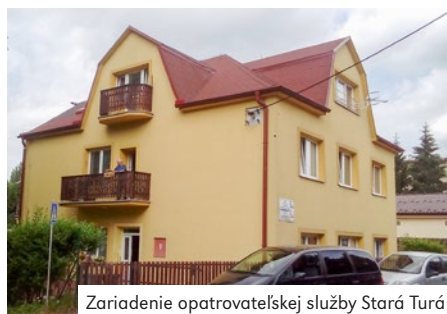
Zariadenie opatrovateľskej služby Stará Turá

Výška úhrady za poskytované služby sa určuje podľa všeobecne záväzného