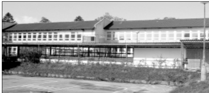
Rekonštrukcia ZŠ za prostriedky EÚ- pavilóny na Komenského ulici menia svoj vzhľad. J.M.

MŠ spolu: 54 561 eur z toho: Hurbanova 142 (dolná) - 27 538 eur Hurbanova 153 (horná) - 27 023 eur