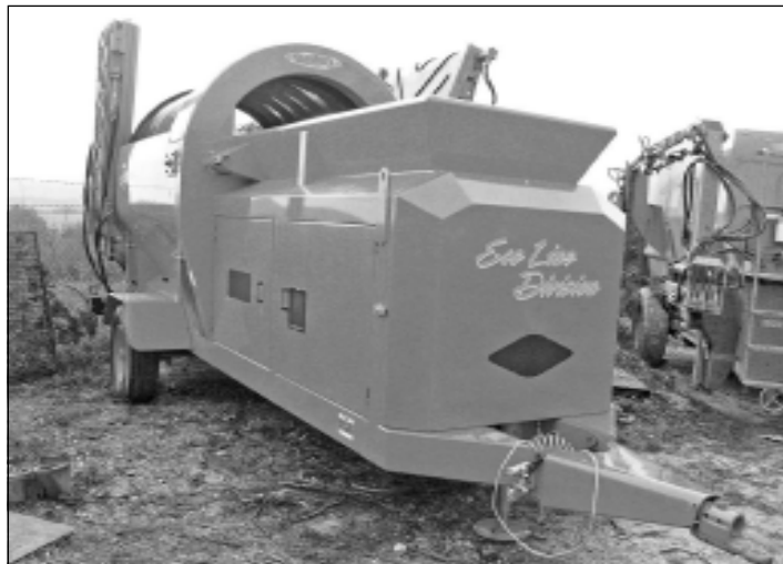
Nová technika v rámci technológie projektu Kompostáreň bola zakúpená z prostriedkov EÚ.

Celkové finančné náklady predstavujú 885 tis. eur z toho vlastné zdroje predstavujú čiastku 54 tis. eur Realizácia projektu bola začatá vo februári 2009, ukončenie bude v máji 2010.