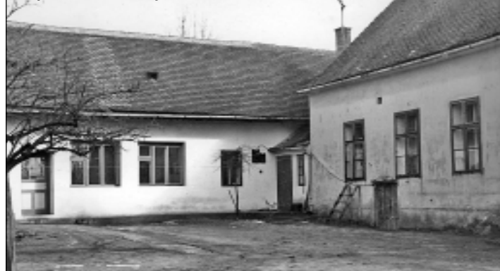
Pohľad z dvora – tretia učebňa adaptovaná z uč. bytu