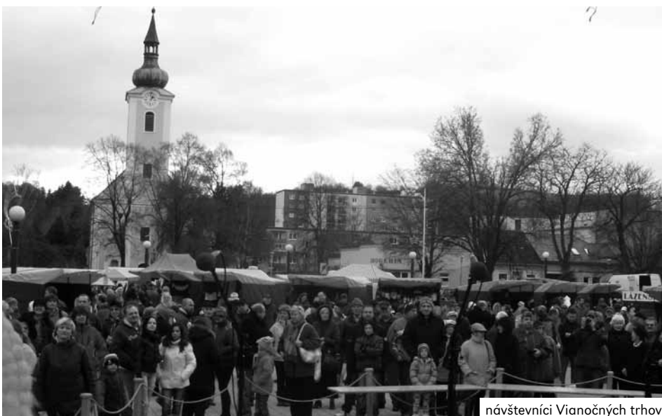
návštevníci Vianočných trhov