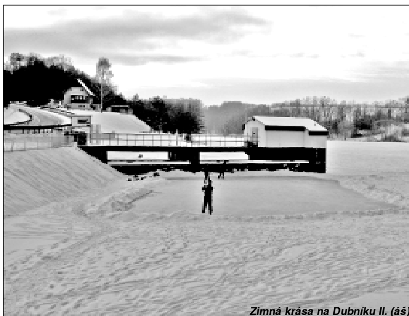
Zimná krása na Dubníku II. (áš)