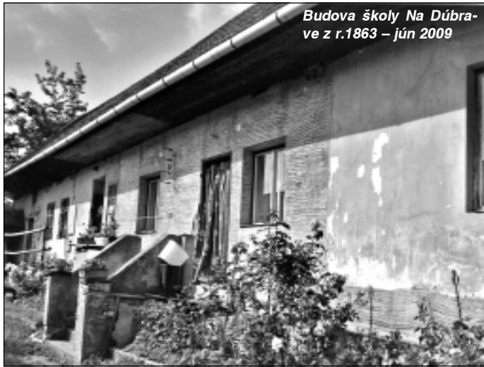
Budova školy Na Dúbrave z r.1863 – jún 2009