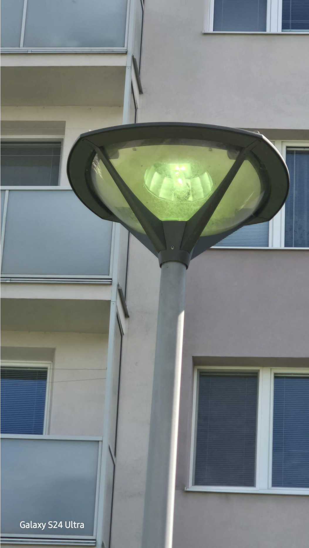
Galaxy S24 Ultra