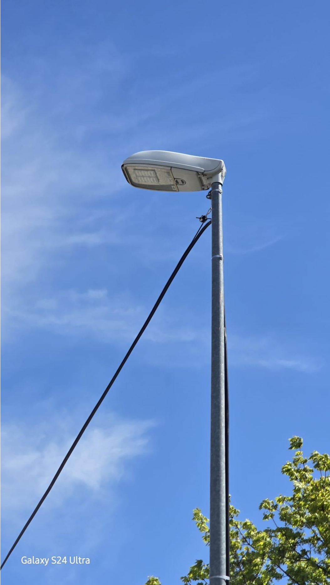
Galaxy S24 Ultra