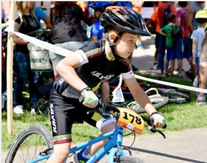
zdvoj: fb novodubnický superbiker