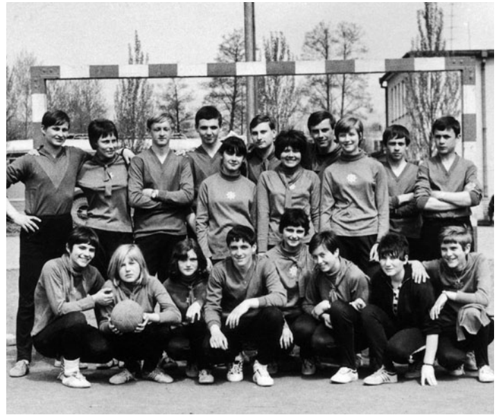
Dorastenky a dorastenci 1. mája 1968

Vo februári 1968 sme sa ešte zúčastnili 4. ročníka zimnej súťaže. Zohrali sme ešte niekoľko zápasov jarnej súťaže a potom sa už naše družstvo rozpadlo. Dorastenky OU ešte v činnosti pokračovali a zúčastňovali sa rezortných súťaží.“