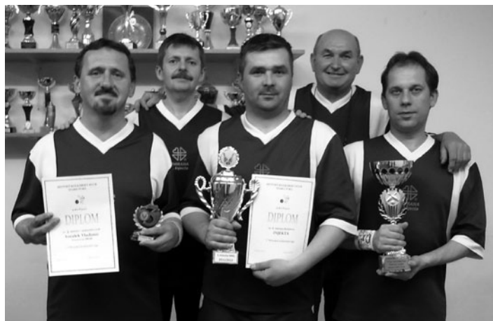
Víťaz MKL INJEKTA