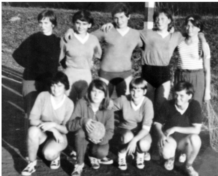
Nové družstvo dorasteniek