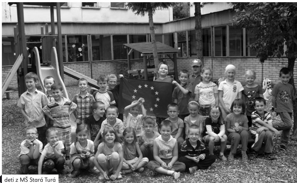
deti z MŠ Stará Turá