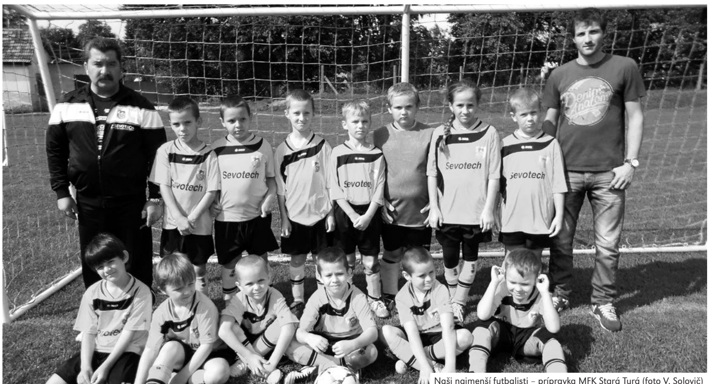
Naši najmenší futbalisti – prípravka MFK Stará Turá