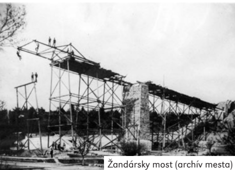
Žandársky most (archív mesta)

(vybraté z archívu bulletinov mesta Stará Turá, r. 2008)