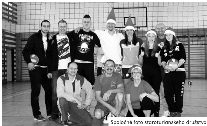
Spoločné foto staroturianskeho družstva