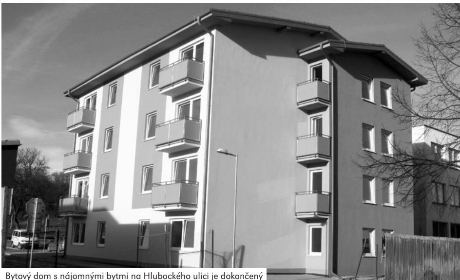
Bytový dom s nájomnými bytmi na Hlubockého ulici je dokončený