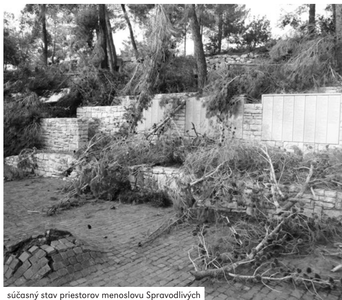
súčasný stav priestorov menoslovu Spravodlivých