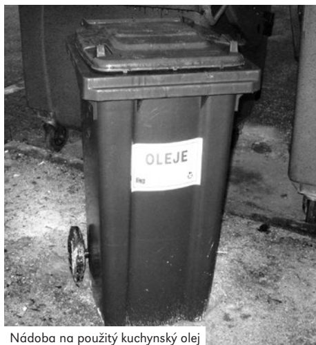
Nádoba na použitý kuchynský olej