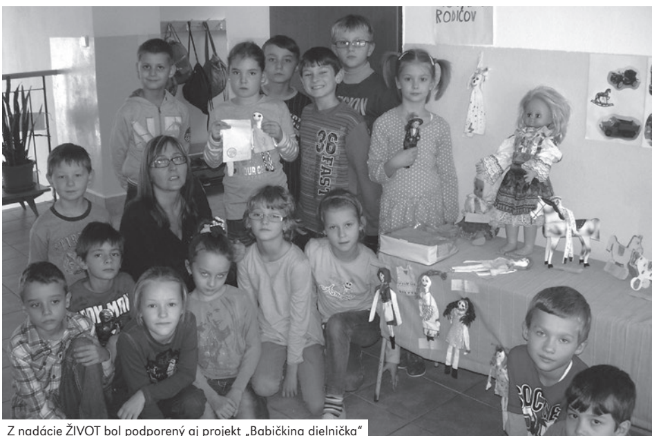
Z nadácie ŽIVOT bol podporený aj projekt „Babičkina dielnička“