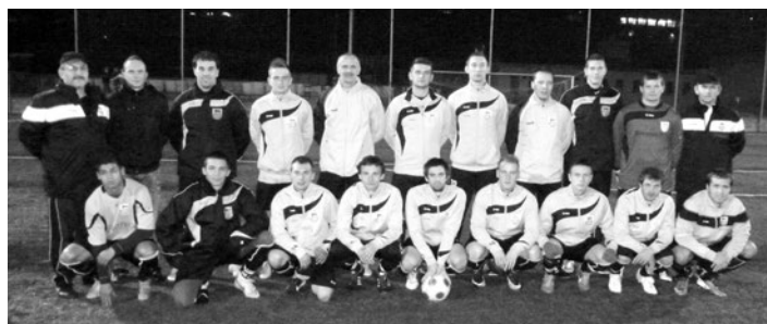
A mužstvo po jesennej časti 2013