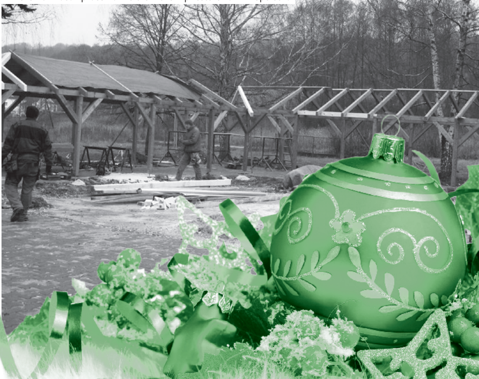
V novembri začali práce na Multifunkčnom priestore za DK Topolecká