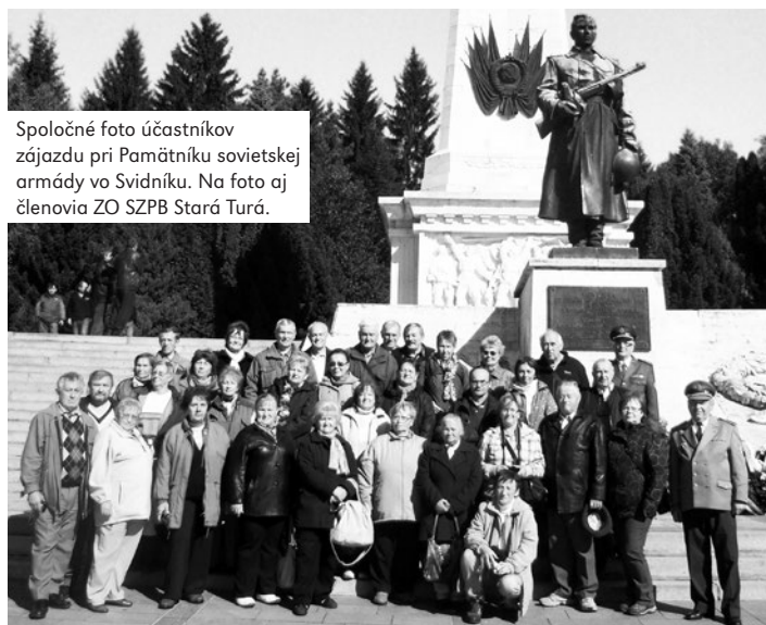
Spoločné foto účastníkov zájazdu pri Pamätníku sovietskej armády vo Svidníku. Na foto aj členovia ZO SZPB Stará Turá.

Dňa 5. 10. 2013 pri Pamätníku československých vojakov na Dukle, pri soche armádneho generála Ludvíka Svobodu vo Svidníku, ktorý velil jednotkám prvého československého armádneho zboru v Sovietskom zväze a Pamätníku sovietskej armády vo Svidníku sme sa zúčastnili pietneho aktu kladenia vencov. Pri Pamätníku československých vojakov na Dukle, kde si stovky ľudí pripomenuli 69. výročie Karpatsko-duklianskej operácie, ktorú odborníci považujú za jednu z najťažších bitiek 2. svetovej vojny v strednej Európe, mal slávnostný príhovor minister obrany Martin Glváč, ktorý ocenil siedmich priamych účastníkov oslobodzovacích bojov pamätnými medailami. Vo svojom príhovore vyzdvihol odvahu tých, ktorí bojovali a padli za oslobodenie vlasti. Tiež zdôraznil, že je dôležité hľadať nové formy, ako mladých pritiahnúť k histórii. Taktiež na uvedených oslavách na Dukle a vo