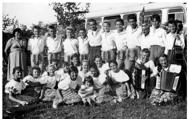
Starý Hrozenkov – Kopaničiarske slávnosti, júl 1961

Na nácviky sme chodili radi a vždy sme sa na ne tešili. A to preto, že sme boli dobrý kolektív, vládlo tam skutočné kamarátstvo bez falošnosti a závidosti. Spájala nás i spoločná túžba zvíťaziť na okresnej súťaži. To sa nám však nepodarilo. Napriek našej snahe a nadšeniu, ktoré sme do vystúpenia dali, zvíťazili Kostolanci a my sme skončili na 2. mieste.