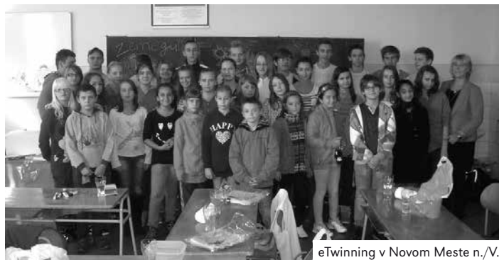
eTwinning v Novom Meste n./V.