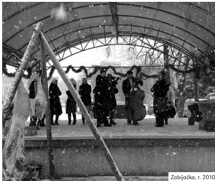
Zabíjačka, r. 2010

Našťastie Dom kultúry Javorina a naše mesto každoročne organizujú viac podobných akcií. Najbližšie nás čakajú vianočné trhy spojené s tradičnou zabíjačkou, ktoré sa väčšinou konajú druhý decembrový týždeň, tento rok to bude v sobotu 15. decembra. Cez vianočné trhy je atmosféra asi najkrajšia, pretože ak sa podarí, napadne sneh a všetko bude krásne biele. Medzi stánkami bude rozvoniavať hriatô, medovina, varené víno či grog. A aby nám neškvrkalo v bruchu, v sobotu, keď sa koná zabíjačka, je možnosť ochutnávky čerstvo