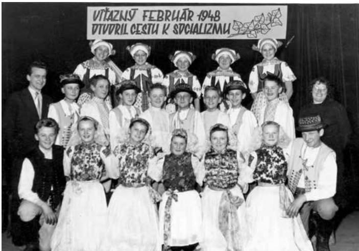
Vystúpenie s pásmom Družba Čechov a Slovákov