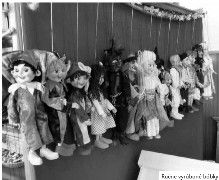
Ručne vyrábané bábk