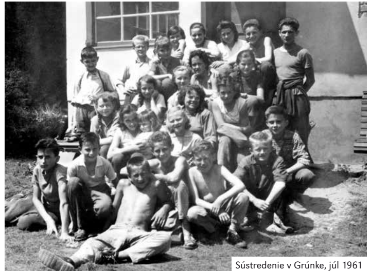
Sústredenie v Grúnke, júl 1961