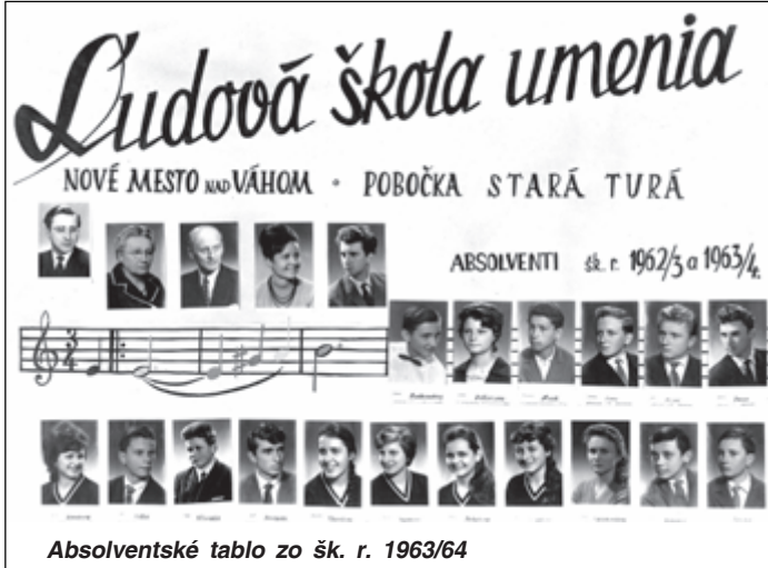
Absolventské tablo zo šk. r. 1962/3 a 1963/4

Postupne sa škola vybavovala i hudobnými nástrojmi. Vlastne až pri písaní tohto článku som sa dozvedela, že som sa učila hrať na harmonike