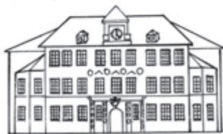
od r. 1912 Basenýkyn meš. šk. škola Stredná škola, 055, 205, 194 uč. z. 75, 245 od r. 2009

Je až neuveriteľné, koľko prvenstiev v oblasti školstva na Slovensku má Stará Turá: prvá kopaničiarska škola (evanj. škola Papraď, r. 1852), prvé podávanie teplej stravy v evanj. škole Na Dúbrave na zač. 20. stor., prvá opatrovňa detí v býv. štát. škole počas 2. svet. vojny a stavba budovy meštianky, ktorá bola po 1. svet. vojne najväčšou šk. budovou ešte niekoľko rokov.