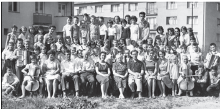
Učitelia a žiaci LŠU v šk. r. 1961/62