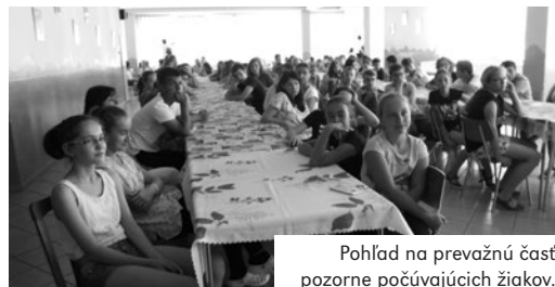
Pohľad na prevažnú časť pozorne počúvajúcich žiakov.