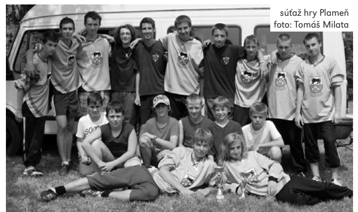
súťaž hry Plameň