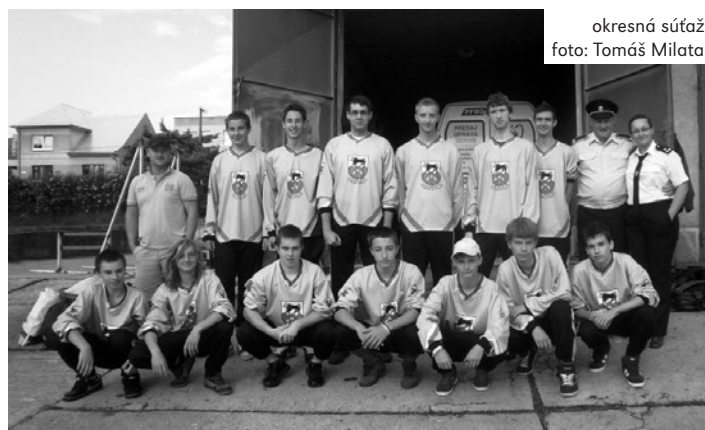
okresná súťaž

Vítanom chceme popriať nech sa im vo vyššom kole darí, čo najlepšie a našim ďalším plánom je zúčastňovať sa pohárových súťaží. Veríme, že budú naše výsledky rásť takou rýchlosťou, akou majú naši chlapci chuť trénovať! Vopred ďakujeme všetkým našim priaznivcom, sponzorom a priateľom za podporu. Pre viac informácií, fotiek a videí nás nájdete aj na www.facebook.com/DhzStaraTura . Veľká vďaka patrí i p. Markovovi a Tomášovi Milatovi za fotodokumentáciu a videá. Ing. Michal Chlebík