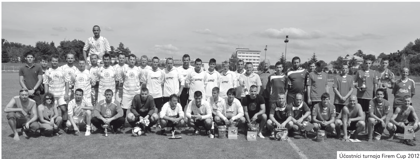
Účastníci turnaja Firem Cup 2012