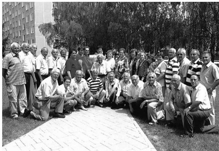
Stretnutie po 50. rokoch, Stará Turá 29. 6. 2012.