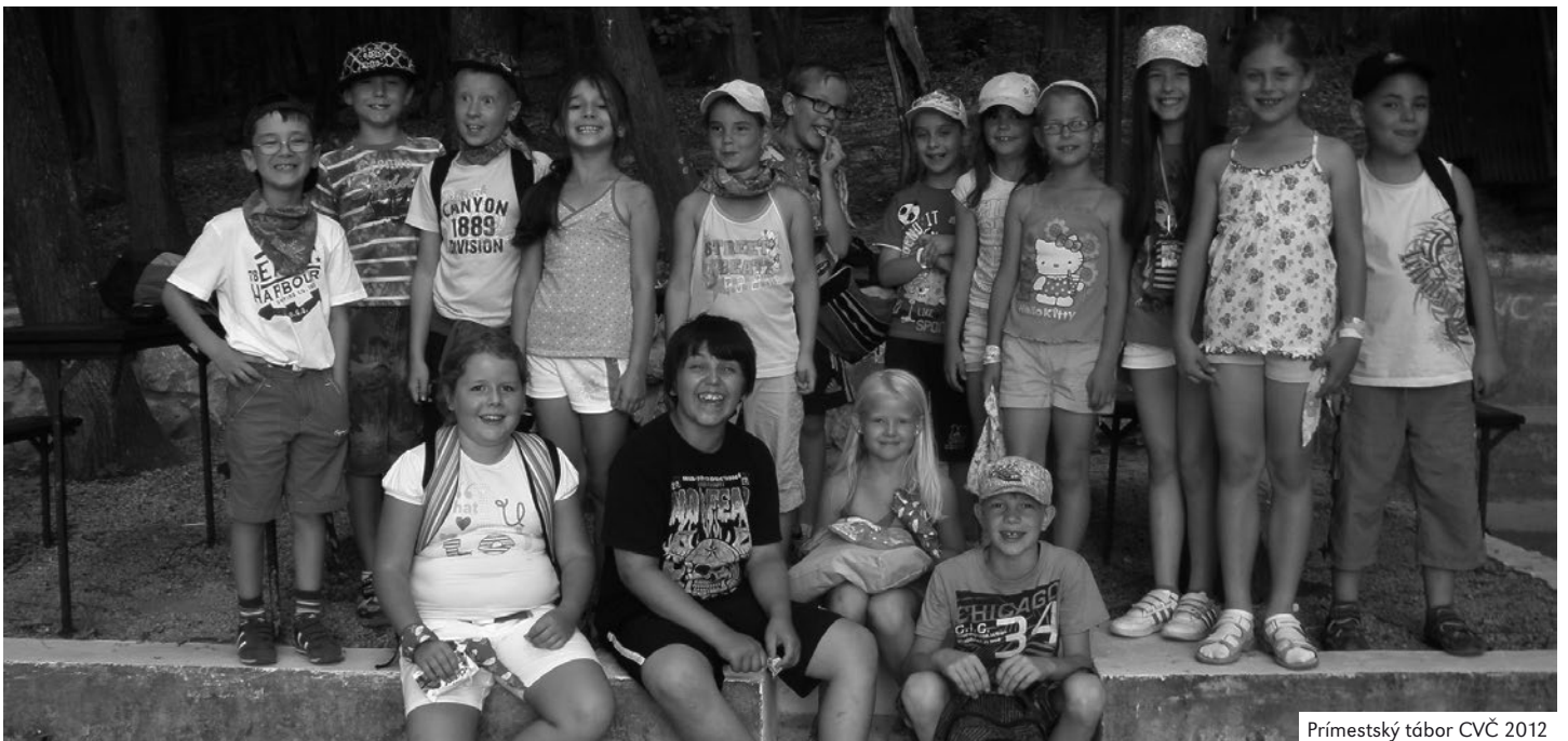
Prímestský tábor CVČ 2012