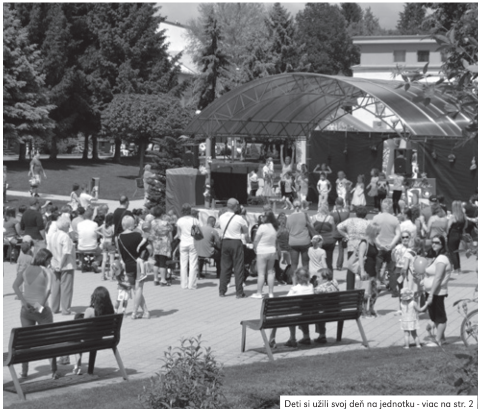
Deti si užili svoj deň na jednotku - viac na str. 2