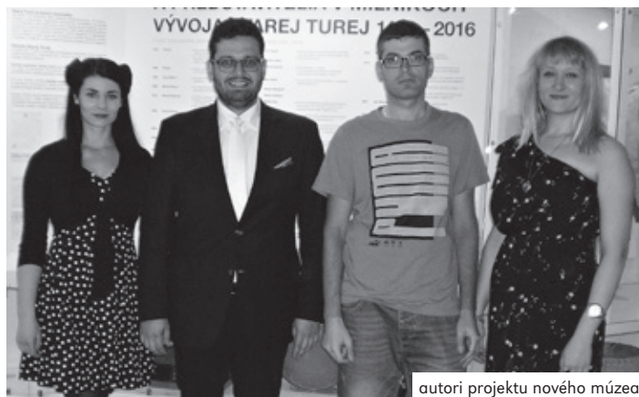
autori projektu nového múzea