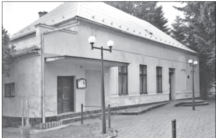
„Malá škola“ – evanj.škola pre malé deti – 7. miesto od r.1909 do r.1923