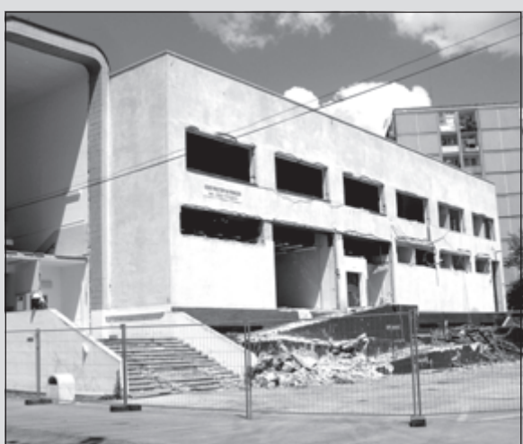
Rekonštrukcia obchodného domu sa začala...