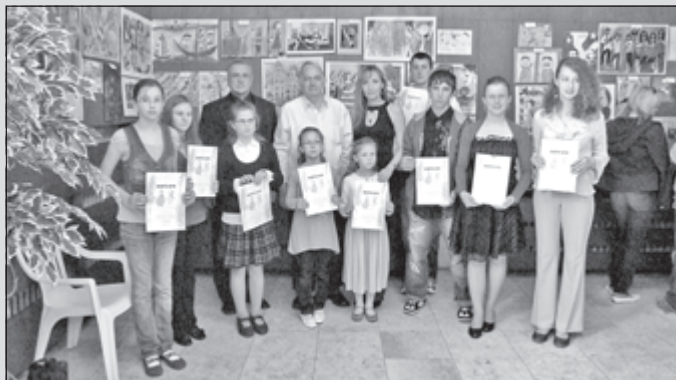
Ocenení žiaci zo Starej Turej na vernisáži usporiadanej Spoločnosťou priateľov Kuby na Slovensku.