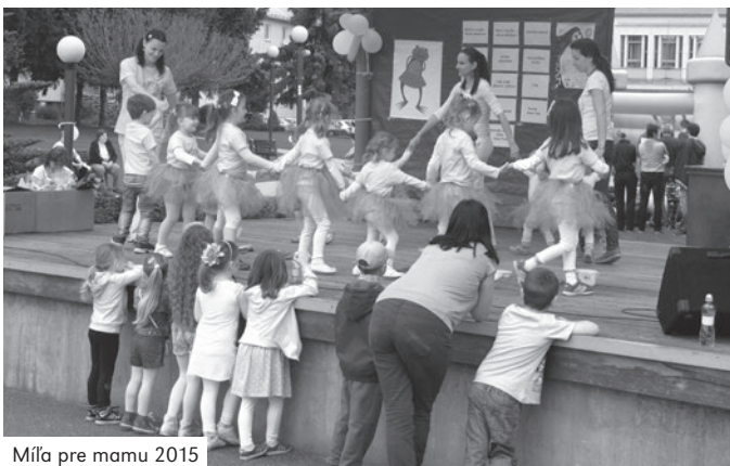
Míľa pre mamu 2015