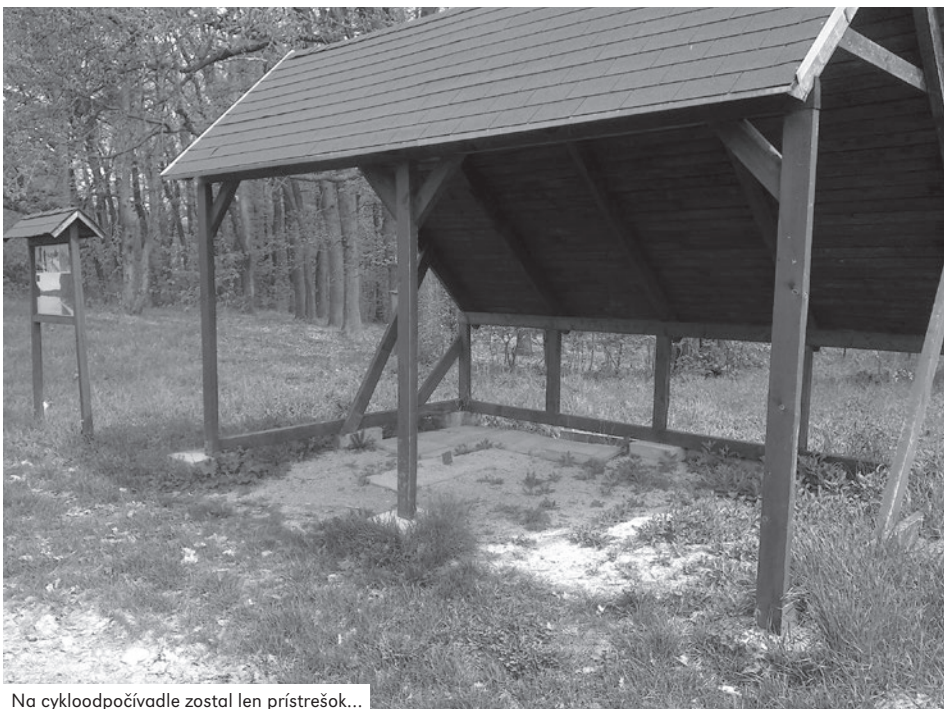
Na cykloodpočívadle zostal len prístrešok...