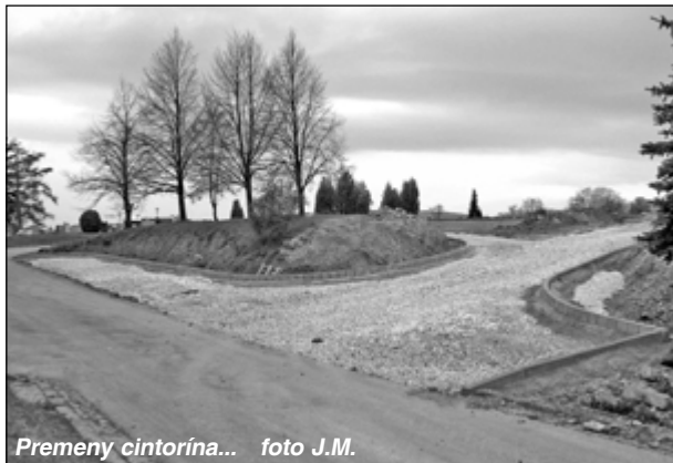
Premeny cintorína...

hle bude podpísaná zmluva s MV a RR SR v Bratislave o poskytnutí finančnej dotácie začnú práce na tejto stavbe. Podľa zmluvy s dodávateľom, lehota realizácie je 18 mesiacov. Rekonštrukciou prejdú štyri