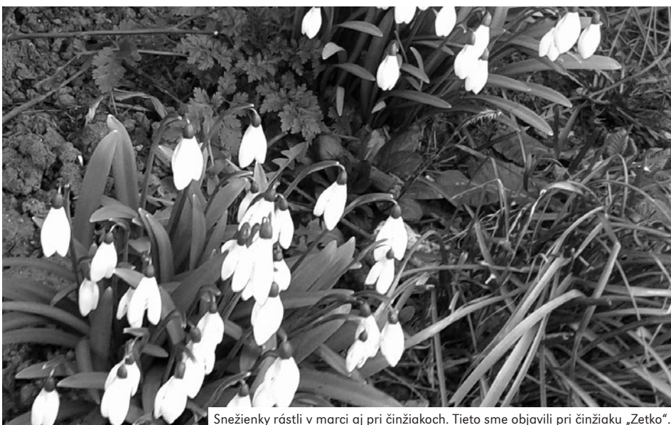
Snežienky rástli v marci aj pri činžiakoch. Tieto sme objavili pri činžiaku „Zetko“.