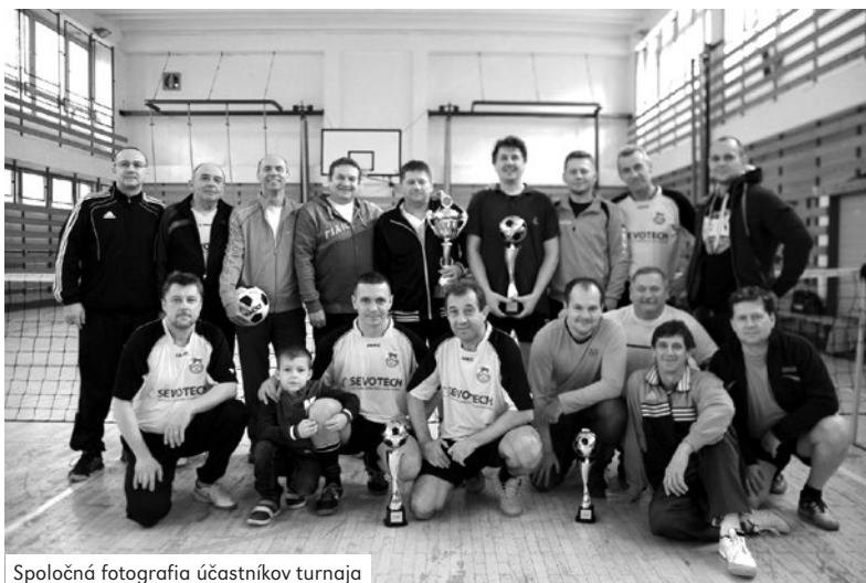
Spoločná fotografia účastníkov turnaja