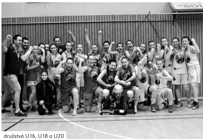
družstvá U16, U18 a U20