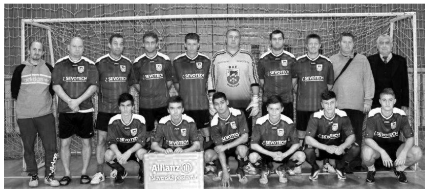
Družstvo SEVOTECH Stará Turá: