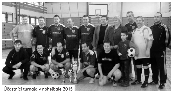
Účastníci turnaja v nohejbale 2015

(11:7, 11:8). Sevotech vo finále vyhral po veľmi vyrovnanom zápase 2:0 (11:6, 11:10) a obhájil minulo-ročné prvenstvo.