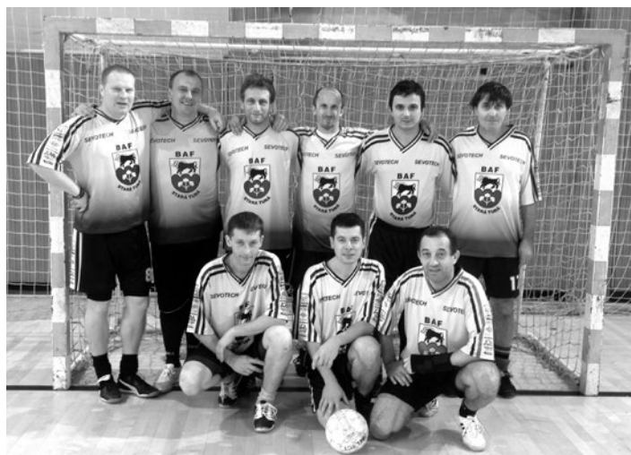
mužstvo BAF Stará Turá