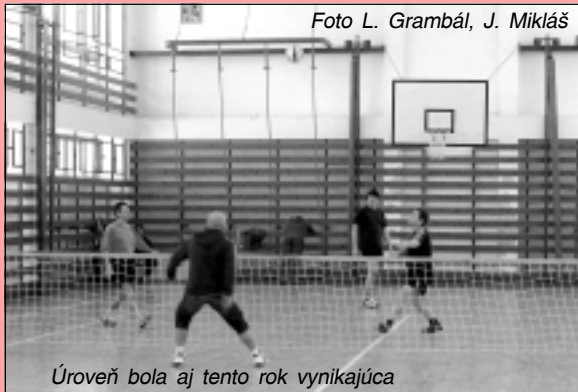
Úroveň bola aj tento rok vynikajúca