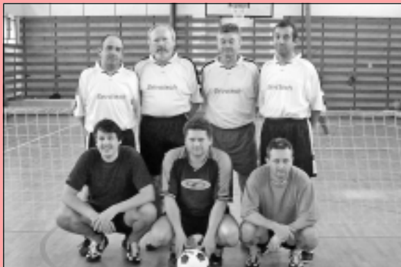
Finálové družstvá- horný rad Sevotech, dolný rad SBDO I.