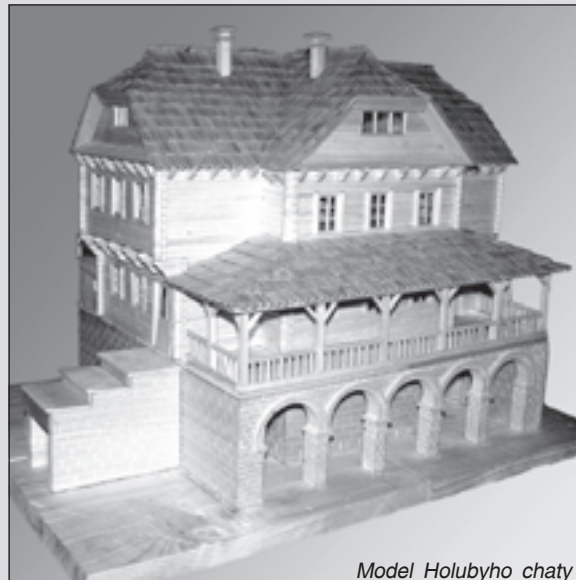
Model Holubyho chaty

Mesto Stará Turá bola v roku 2010 partnerom Regiónu Biele Karpaty v projekte „Javorina – symbol spolupráce Slovákov a Čechov“ s podtitulom „Prírodné perly Euroregiónu – vrcholy, rozhľadne a chaty“. Predmetom projektu boli aktivity a výstupy, súvisiace s Veľkou Javorinou a jej bezprostredným okolím. A najprírodzenejším východiskom na jej vrchol je práve mesto Stará Turá.