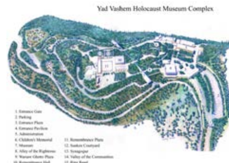
Inštitúcia Yad Vashem v Jeruzaleme